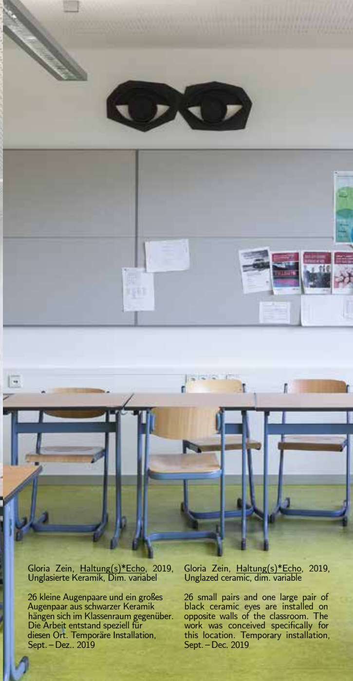
Gloria Zein, Haltung(s)*Echo , 2019, Unglasierte Keramik, Dim. variabel

26 kleine Augenpaare und ein großes Augenpaar aus schwarzer Keramik hängen sich im Klassenraum gegenüber. Die Arbeit entstand speziell für diesen Ort. Temporäre Installation, Sept. – Dez. 2019